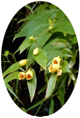
キイジョウウロウホトトギス