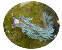
ムカデミノウミウシ